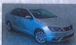
SEAT Toledo 1.6 TDI 85 kW (115 cv) Reference Plus Año 2015 - 0 km. 15.500 €*