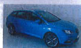
SEAT Ibiza ST 1.6 TDI 65 kW (90 cv) Style I-TECH Año 2015 - 0 km. 13.900 €*

*Oferta de financiación para clientes particulares y autónomos que financien a través de Volkswagen Finance SA EFC aplicable a todos los vehículos SEAT con hasta dos años de antigüedad disponibles en la Red Das WeltAuto SEAT, sujeta a un capital mínimo de 8.000 €, una duración y permanencia mínima de la financiación de 48 meses. La oferta incluye 1 Año de garantía adicional gratis y 4 años de mantenimiento SEAT Service o 60.000 Km (lo que antes suceda) válida hasta el 31/03/2016. Campaña incompatible con otras ofertas financieras.