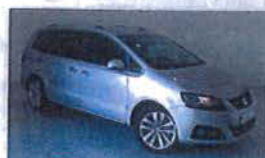
SEAT Alhambra 2.0 TDI 130 kW (177 cv) Style Año 2014 - 13.700 km. 31.900 €*