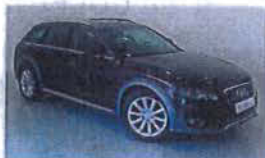
Audi A4 QUATTRO 2.0 TDI 125 kW (170 cv) ALLROAD Año 2011 - 146.000 km. 25.900 €

1.000 € de bonificación + 1 año de garantía adicional + 4 años de mantenimiento gratis*.