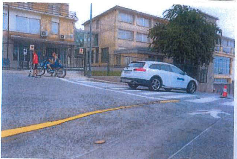
Las calles Santesteban y San Pol tienen ahora sólo un sentido y cuentan con arcén señalizado para peatones.

Durante el día de ayer los servicios municipales se encargaron de las labores de señalización y pintado de las dos vías para tenerlas listas hoy en el primer día de curso de ambos centros, uno de Secundaria y otro de Formación Profesional.