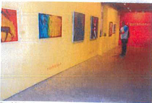
Dos visitantes observan la muestra inaugurada ayer.

La matrícula puede realizarse en el IES Tierra Estella los martes de 10 a 13 horas hasta el próximo 6 de octubre. Para más información sobre los requisitos puede consultarse la página de la escuela de idiomas: www.eoidna.es .