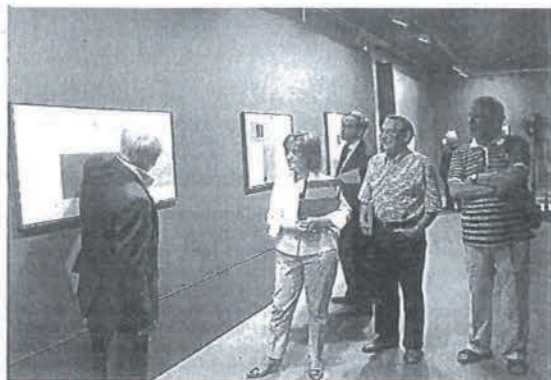
Las explicaciones del pintor ayudaron a entender su obra.

Los conceptos y objetivos a trabajar en el taller serán los siguientes: conocer las cualidades cromáticas en una obra de arte en lo que se refiere al componente afectivo, así como trabajar sobre diferentes formatos y jugar con las texturas de los materiales como forma de expresión. También, se abordará el concepto de volumen para poder repre-