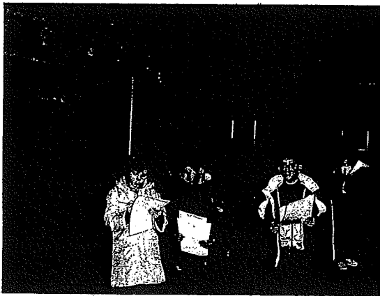
Escolares, realizando una de las actividades en el museo.

Las actividades, ofrecidas gratuitamente a todos los centros educativos de la merindad, fueron impartidas tanto en castellano como en euskera, adaptándose a las exigencias del currículo escolar. La encargada de coordinar las visitas guiadas, previa petición de hora, ha sido la empresa de turismo y dinamización de ocio cultural, Navark.