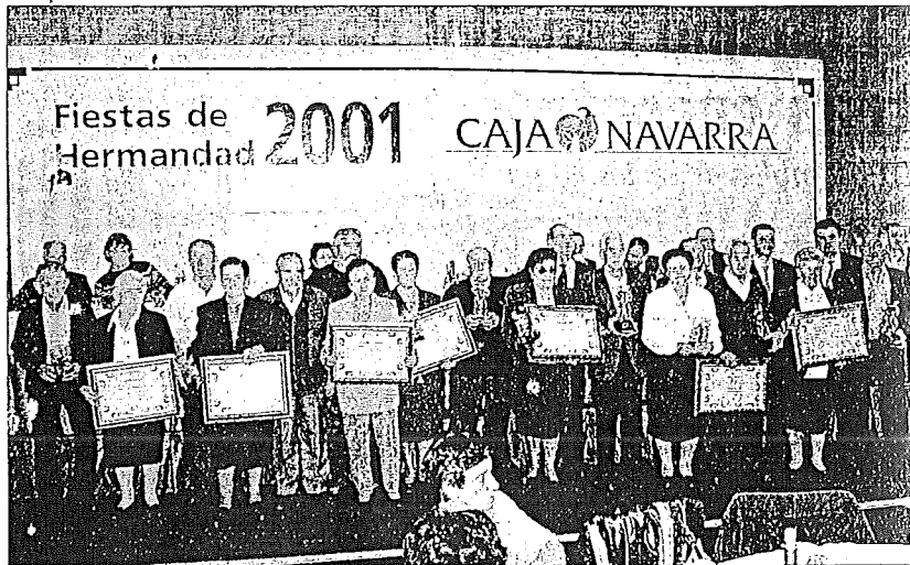
Los matrimonios homenajeados durante la fiesta de los jubilados que se celebró en Mendavia.