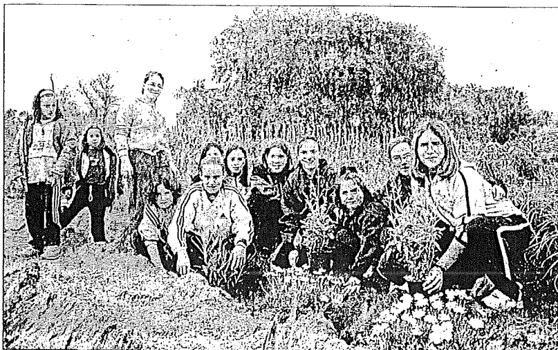
Un momento de la plantación realizada ayer en el paraje de la Barca, que se extiende a orillas del Ebro.