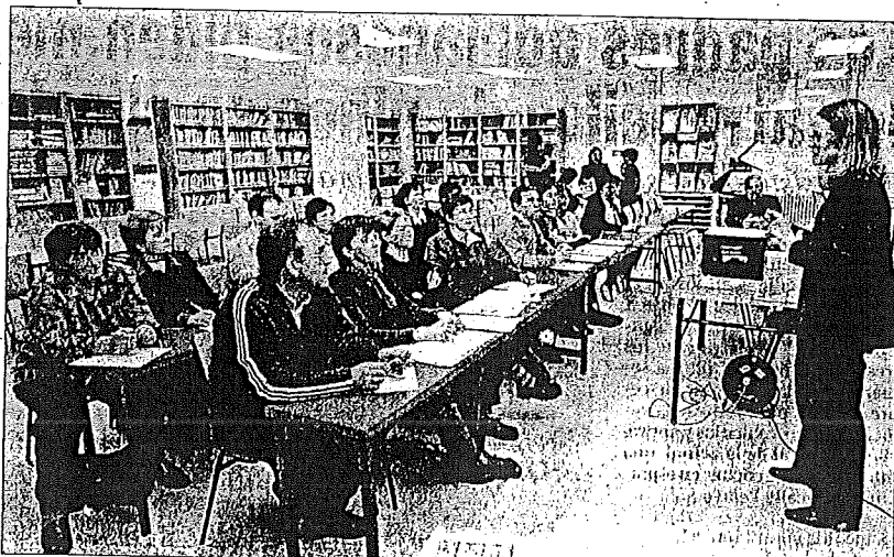
Las sesiones se realizaron en la biblioteca del instituto, donde los padres trabajan en grupo los casos prácticos.

Paralelamente, los 140 alumnos de cuarto de secundaria, dirigidos por los profesores del departamento de Filosofía, han abordado a lo largo de seis clases los problemas de la violencia y cómo y porqué se manifiesta en su edad. Estas sesiones de trabajo, que en breve se realizarán en Los Arcos, finalizarán con un encuentro con los profesores para tratar el fracaso escolar.