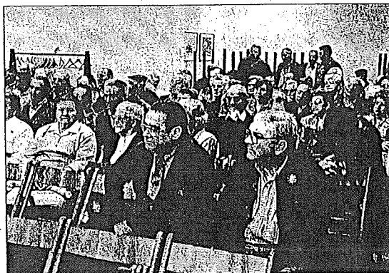
PARTICIPACIÓN La asamblea contó con un alto número de asistentes. A.J.

El secretario quiso agradecer la colaboración de Caja Navarra, entidad con la que el club de jubilados mantiene una estrecha relación. "La asociación no dispone de economía suficiente para hacer frente a las rentas a satisfacer. La caja nos ha ofrecido su colaboración. Todo lo que hemos de hacer