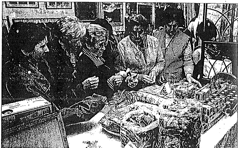
Los voluntarios se afanaban ayer en los últimos retoques al rastriero organizado para ayudas a las obras de San Juan.

El rastriero estará abierto de lunes a viernes de cinco a ocho de la tarde, mientras que los jueves, sábados y domingos el horario se ampliará también a las mañanas de doce a dos. Está previsto que la venta de productos continúe hasta finales de abril.