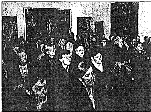
Público asistente al ciclo que sobre las Reinas de Navarra se celebra en Estella.