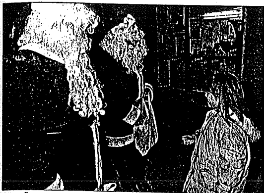
ENTRAÑABLES Los niños se ilusionan con Santa Claus. MARIAN TRÉBOL