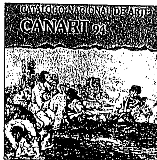
PORTADA Esta es la portada del Catálogo Nacional de Arte en su edición de 1994. Como se observa, el título ha pasado de ser Ibérico 2000 a Canari .