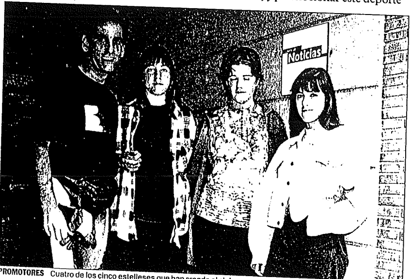
PROMOTORES Cuatro de los cinco estellese que han creado el club.

Otro de los objetivos, a largo plazo, es potenciar actividades como el patinaje artístico y el hockey sobre ruedas.