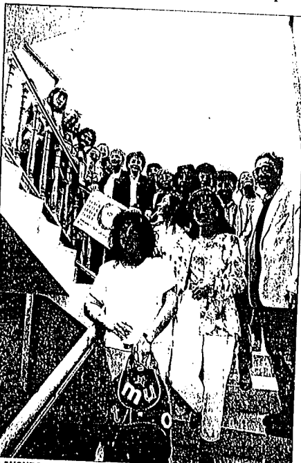
CLAUSURA Las participantes quedaron satisfechas.