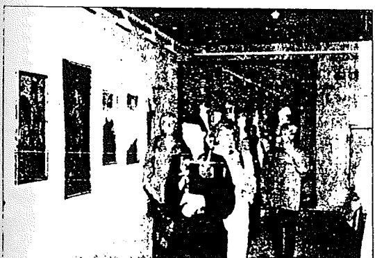
Un grupo recorre el museo estellés. Echeverría