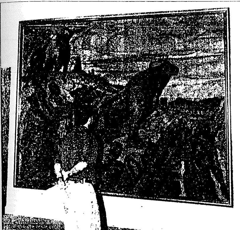
Un visitante contempla una de las obras características de Maeztu: «El toro ibérico» (1945-47. 240x330,5 centímetros).

El director del museo destaca el número de las personas que visitan las salas de Estella, especialmente las de Pimpón y otros espacios de Navarra, así como de Logroño y con Logroño, de Logroño y, con Logroño, un total de casi 19.000 visitas en este último año, un 30% son personas que según sobre todo en verano, en el mes de agosto se realizan por Estella, lo que permite la posibilidad de visitar al museo.