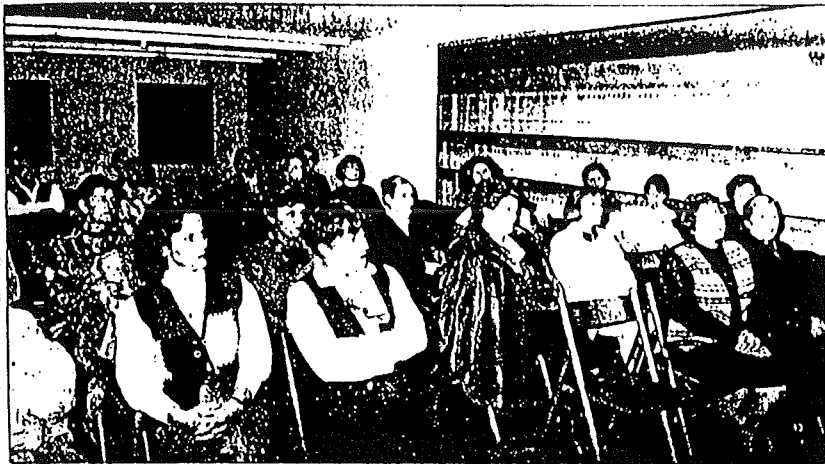
El curso cuenta con una amplia mayoría femenina.